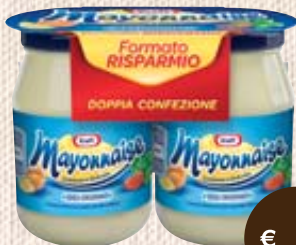
MAYONNAISE KRAFT REGULAR 200ML X2