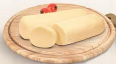
FORMAGGIO FILATA 5KG C.A. AL KG