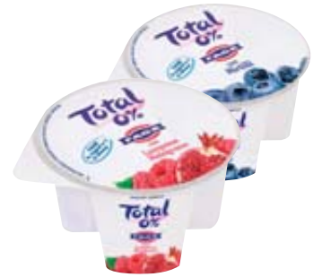
YOGURT TOTAL 0% SPLIT FAGE GUSTI ASSORTITI 170G