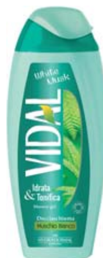
DOCCIA SCHIUMA VIDAL VARI TIPI 250 ML