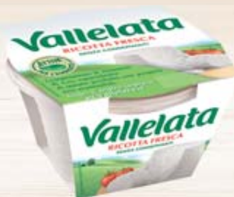
RICOTTA VALLELATA GALBANI 250G