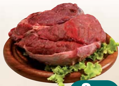
BOVINO ADULTO SCAMONE A CUORE FR SV X2PZ