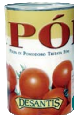
POLPA POMODORI DESANTIS 5KG