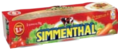
CARNE IN GELATINA SIMMENTHAL 70G X3