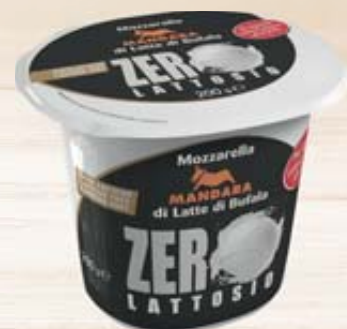
MOZZARELLA DI BUFALA SENZA LATTOSIO MANDARA 200G