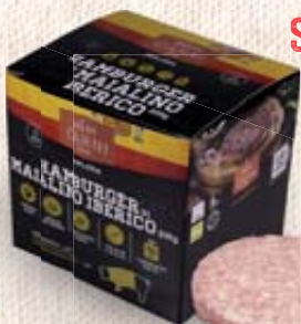
HAMBURGER DI MAIALINO IBERICO 200G 1,600KG