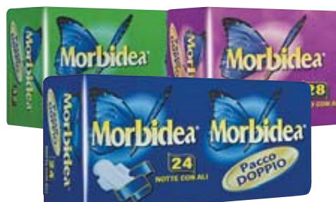
ASSORBENTI MORBIDEA VARI TIPI