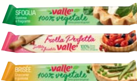
PASTA BRISÉE /SFOGLIA/ FROLLA VALLÈ 230G