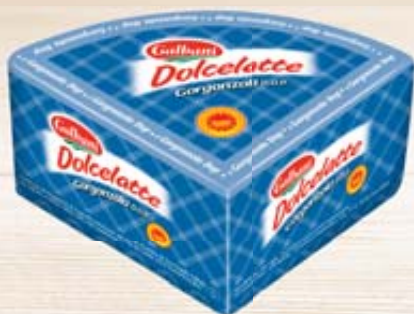
GORGONZOLA DOLCELATTE DOP GALBANI AL KG