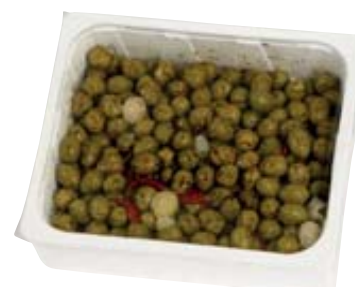
OLIVE BARESANE ROSATE 3,5KG AL KG