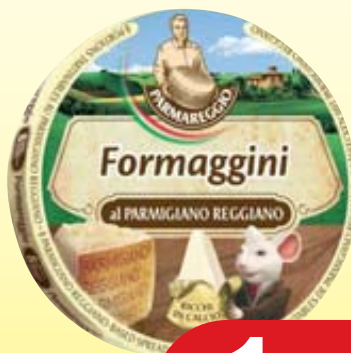
PARMAREGGINI PARMAREGGIO 140G