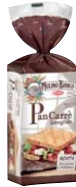
PANCARRÈ MULINO BIANCO INTEGRALE 315G