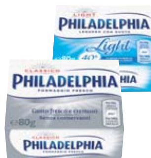
PHILADELPHIA CLASSICA/LIGHT 80G