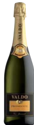
SPUMANTE PROSECCO DOC EXTRA DRY VALDO 75CL