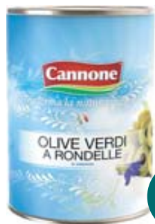
OLIVE A RONDELLE CANNONE VERDI/NERE 4KG AL KG