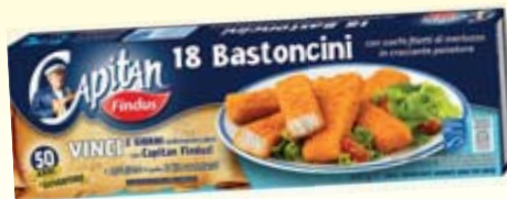
BASTONCINI DI MERLUZZO FINDUS X18 450G