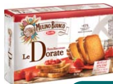
FETTE BISCOTTATE MULINO BIANCO 630G