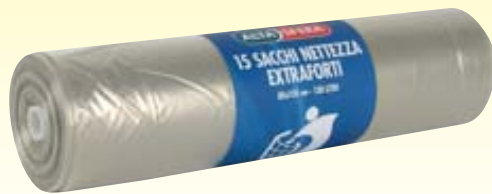
SACCHI N.U. ALTASFERA 15P ROT NEUT 80X120CM