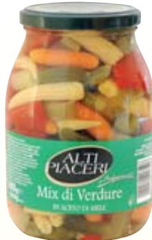
MIX DI VERDURE ALTIPIACERI 1KG