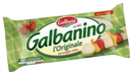
GALBANINO GALBANI 270G