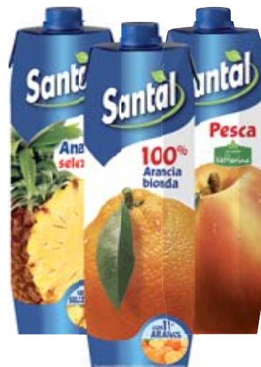
SUCCHI/NETTARE DI FRUTTA SANTAL GUSTI ASSORTITI 1L