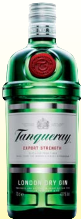
GIN TANQUERAY 70CL