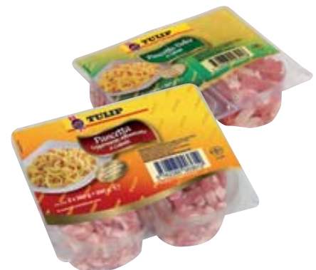
PANCETTA TULLIP AFFUMICATA/DOLCE 100G X2