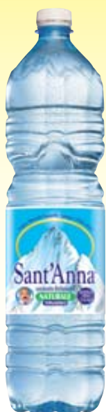
ACQUA NATURALE SANT'ANNA 1,5L