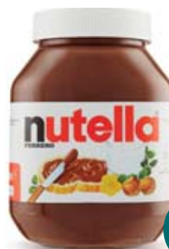
NUTELLA FERRERO 950G