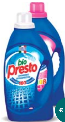
DETERSIVO LIQUIDO LAVATRICE BIO PRESTO VARI TIPI 23 LAVAGGI