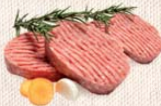
HAMBURGER MISTO X4 DI BOVINO ADULTO/ SUINO 400G C.A. AL PZ