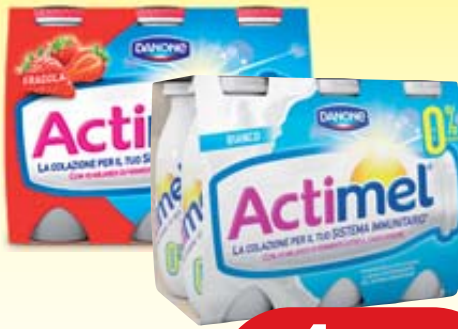
YOGURT ACTIMEL DANONE CLASSICO/ 0,1% 100G X6 VARI GUSTI