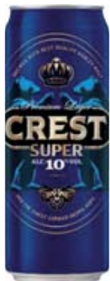
BIRRA CREST 50 CL