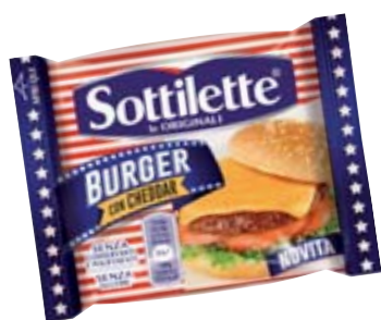
SOTTILETTE BURGER 185G