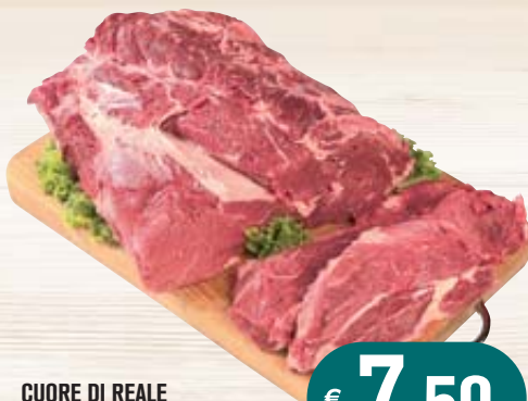
CUORE DI REALE BOVINO ADULTO SV