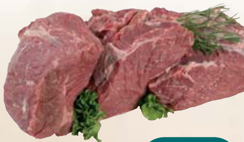
CINGHIALE CONGELATO POLPA 1KG