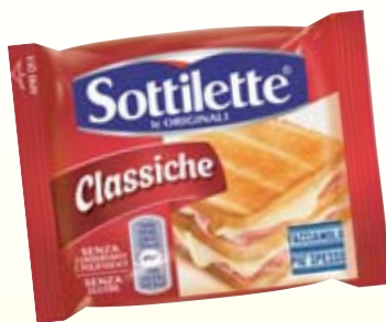
SOTTILETTE CLASSICHE 200G