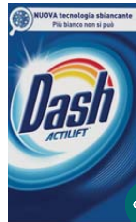
POLVERE DASH CLASSICO 55MIS