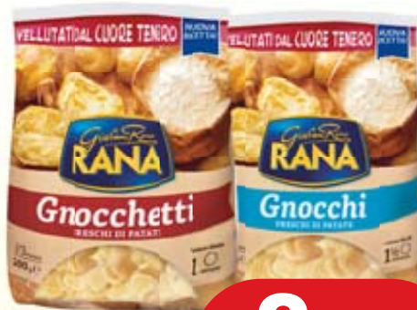
GNOCCHETTI/ GNOCCHI PATATE RANA 500G