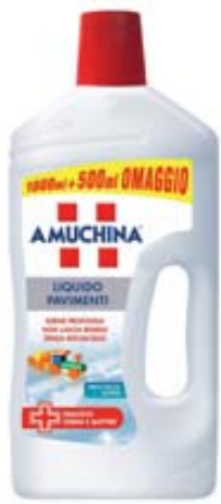
DETERSIVO PAVIMENTI LIQUIDO AMUCHINA 1L+500ML