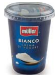
CREMA DI YOGURT BIANCO MULLER INTERO/0% 500G