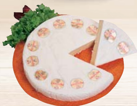
FORMAGGIO BRIÈ PRESIDENT 1KG C.A. AL KG