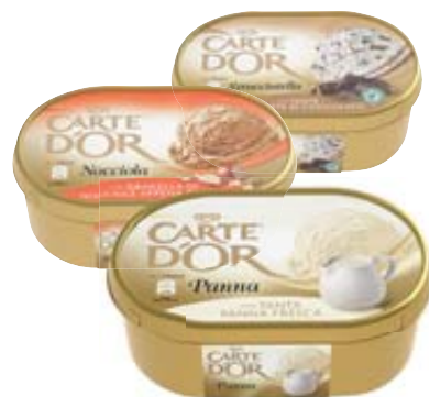
GELATO CARTE D'OR ALGIDA GUSTI ASSORTITI 530G