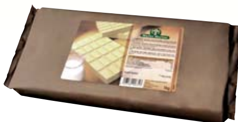
CIOCCOLATO ARIBA BIANCO PANI 1KG