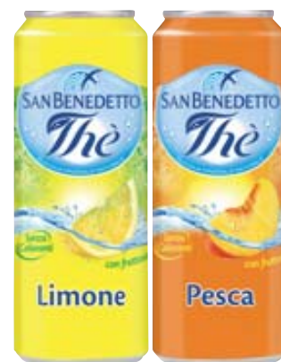
THÈ SAN BENEDETTO LIMONE/PESCA LATTINA 33CL