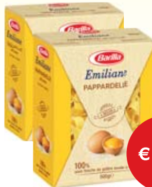
PASTA ALL'UOVO BARILLA VARI TIPI 500G