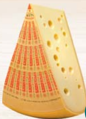
FORMAGGIO EMMENTALER ORIGINALE DOP AL KG