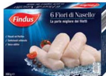
FIORI DI NASELLO FINDUS 300G