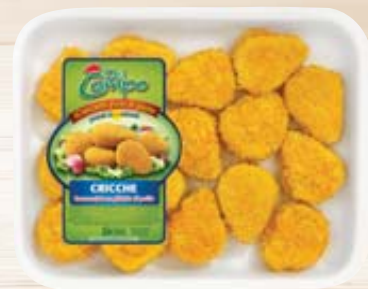
CRICCHE DI POLLO DEL CAMPO 400G