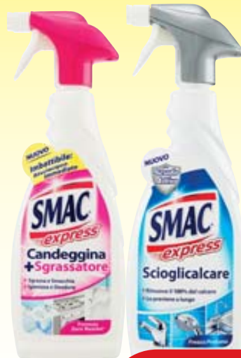
SGRASSATORE SMAC EXPRESS VARI TIPI 650ML