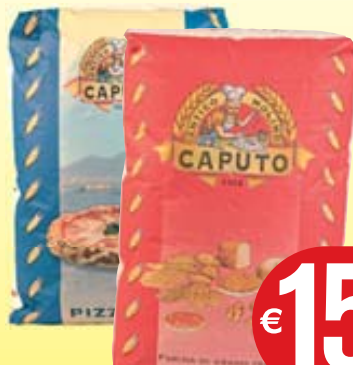
FARINA "00" CAPUTO PIZZERIA/RINFORZATA 25KG