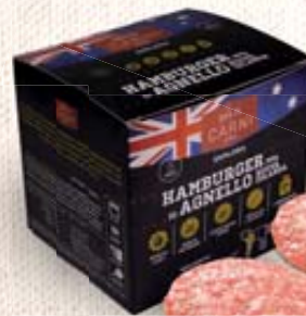
HAMBURGER DI AGNELLO NUOVA ZELANDA 200G 1,600KG