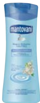
BAGNO DERMOPROTETTIVO NEUTRO MANTOVANI 500ML