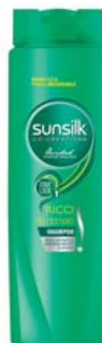
SHAMPOO SUNSIK VARI TIPI 250ML