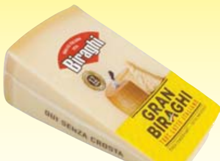
FORMAGGIO STAGIONATO GRANBIRAGHI A SPICCHI 450G