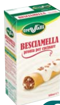
BESCIAMELLA TRE VALLI 500ML