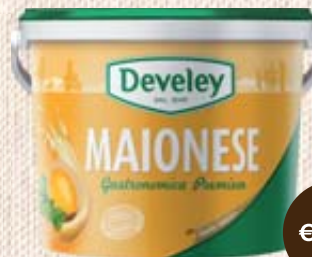
MAIONESE GASTRONOMICA PREMIUM DEVELEY 5KG