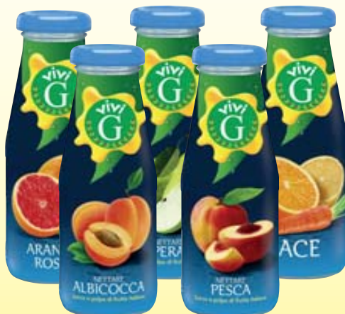
NETTARE BAR VIVI G GUSTI ASSORTITI VETRO 20CL