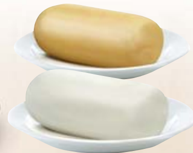
FILANO CLASSICO/AFFUMICATO ASSELITI 4KG