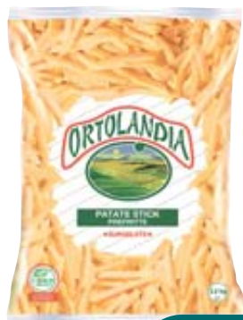
PATATE SURGELATE ORTOLANDIA STICKHOUSE 2,5KG