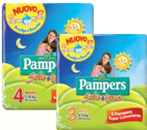
PANNOLINI SOLE E LUNA PAMPERS PACCO BASE MISURE ASSORTITE