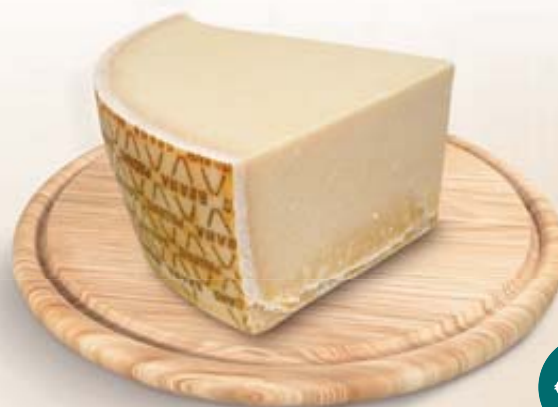
GRANA PADANO DOP 1/8 SV 4,5KG CA AL KG