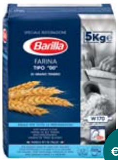
FARINA TIPO 00 BARILLA 5KG