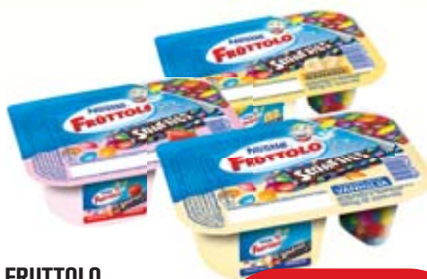
FRUTTOLO YOGURT & SMARTIES NESTLÉ FRAGOLA/VANIGLIA/ BANANA 120G