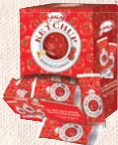
BUSTINE KETCHUP GAIA 12G IN BOX