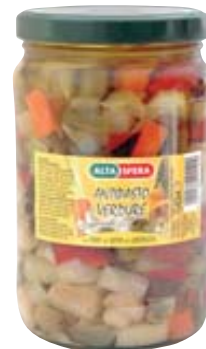
ANTIPASTO DI VERDURE ALTASFERA 1,5KG