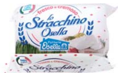
STRACCHINO OSELLA 100G