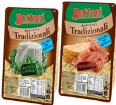
PASTA FRESCA RIPIENA BUITONI VARI TIPI 230G