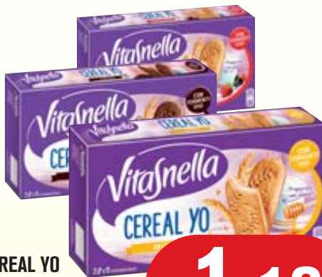
CEREAL YO VITASNELLA GUSTI ASSORTITI 253G