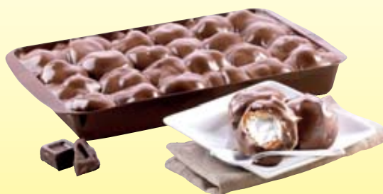
PROFITTEROLES VASCHETTA SCURO MARTINUCCI