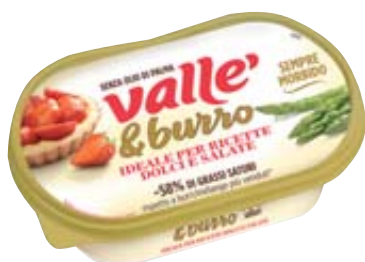
VALLÈ & BURRO 250G MENO GRASSI 6