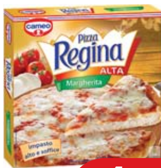
PIZZA REGINA ALTA CAMEO MARGHERITA 370G