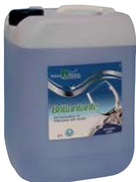
BRILLANTANTE UHP LIQUIDO 5L