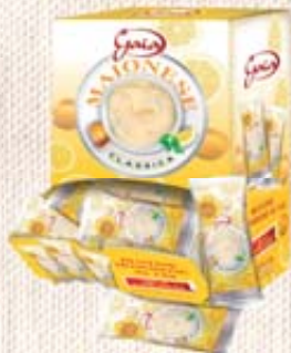
BUSTINE MAIONESE GAIA 12G IN BOX