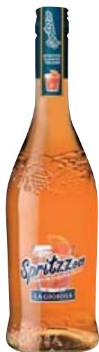
APERITIVO LAGIOIOSA SPRITZ 75 CL