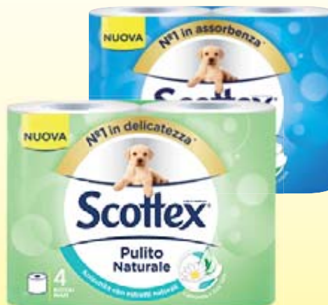
CARTA IGIENICA SCOTTEX PULITO COMPLETO/ NATURALE X4 ROTOLI