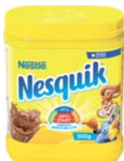
NESQUIK NESTLÈ PLUS 500G