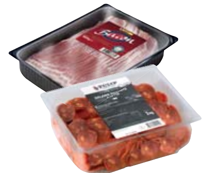
BACON/ SALAME PICCANTE A FETTE TULIP 1KG