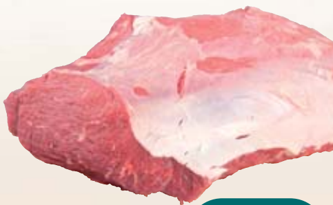
VITELLO SOTTOFESA SQUADRATA SV