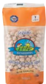
CECI GIGANTI SCHIOPPI 500G BUSTA