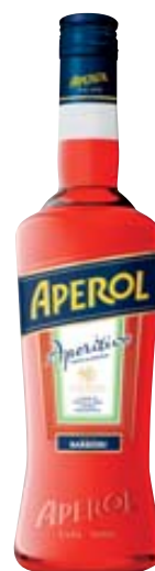
APEROL APERITIVO 1L