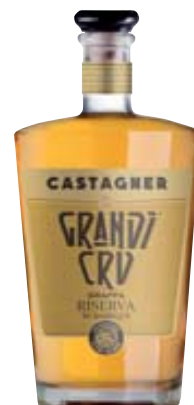
GRAPPA RISERVA CASTAGNER GRANDI CRU 50CL