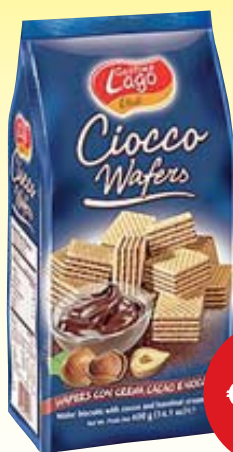
WAFERS ELLEDI 400G