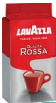
CAFFÈ LAVAZZA QUALITÀ ROSSA 250G