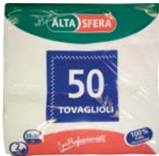
TOVAGLIOLI ALTASFERA 2 VELI 38X38 50 PZ