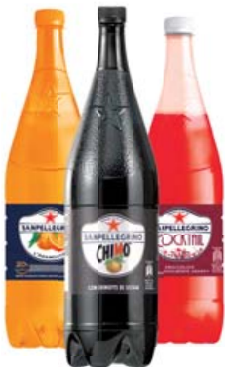
BIBITE SANPELLEGRINO GUSTI ASSORTITI 1,25L