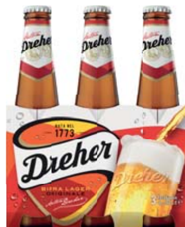
BIRRA DREHER 33CL X 3