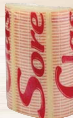
PROVOLONE TRANCIO PICCANTE SORESINA 3,5KG AL KG