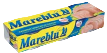
TONNO ALL'OLIO D'OLIVA MAREBLÙ 80G X3