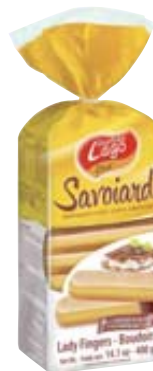
SAVOIARDI ELLEDI 400G