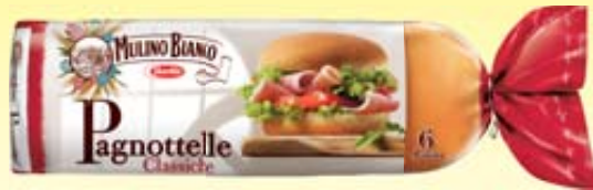
PAGNOTTELLE CLASSICHE MULINO BIANCO 360G