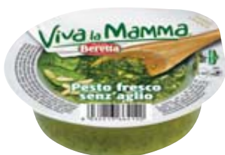
PESTO FRESCO VIVA LA MAMMA CLASSICO/SENZ'AGLIO 90G