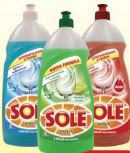
DETERSIVO PIATTI SOLE CLASSICO/ LIMONE VERDE/ ACETO 1,1L