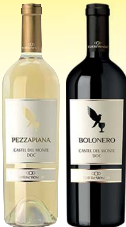
VINO CASTEL DEL MONTE DOC TORREVENTO BOLONERO/ PEZZAPIANA/ PRIMARONDA 75CL