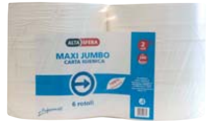
MAXI JUMBO ALTASFERA 2 VELI MT. 340 X 6 PZ