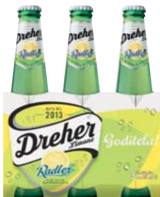
BIRRA DREHER LEMON/POMPELMO 33CL X3