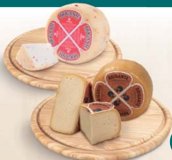
CACIOTTA BRIGANTE PINNA CLASSICA/ PEPERONCINO AL KG