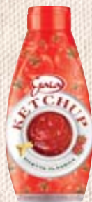
KETCHUP GAIA NATURE TWIST SLV 950ML