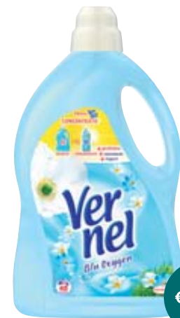
AMMORBIDENTE VERNEL BLU 3L