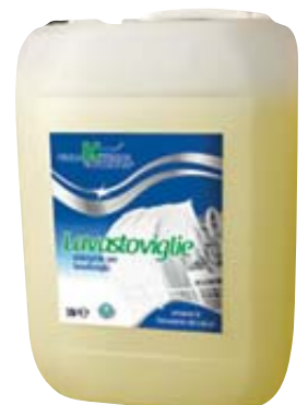
DET UHP LAVASTOVIGLIE 10L