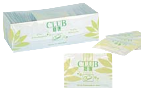
SAVLIETTINE UMIDIFICATE AL LIMONE CLUB 50PZ