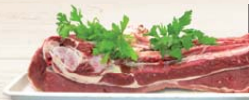
BOVINO ADULTO COPERTINA IRL SV