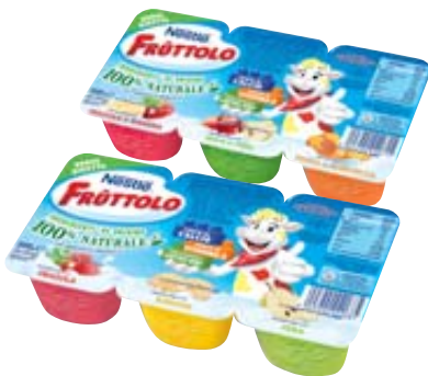
YOGURT FRUTTOLO NESTLÉ GUSTI ASSORTITI 50G X6