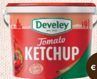
KETCHUP DEVELEY 5KG