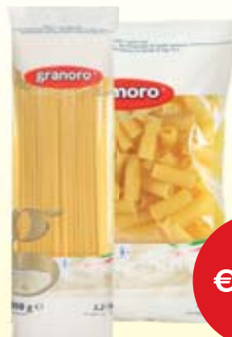
PASTA DI SEMOLA GRANORO VARI FORMATI 1KG