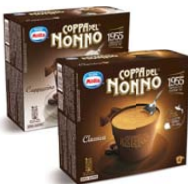
COPPA DEL NONNO MOTTA CLASSICA 288G/ CAPPUCCINO 300G