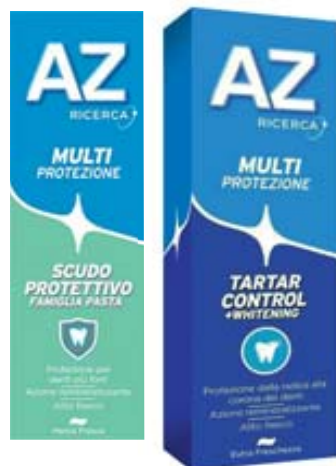
DENTIFRICIO AZ VARI TIPI 75ML