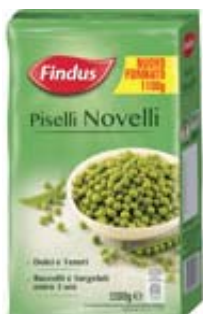
PISELLI NOVELLI FINDUS 1100G