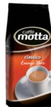
CAFFÈ CLASSICO IN GRANI MOTTA 1KG