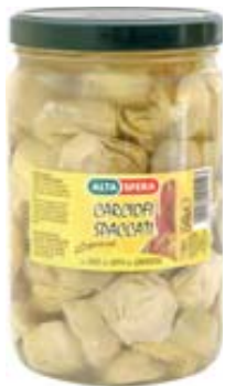
CARCIOFI SPACCATI ALTASFERA 1,5KG