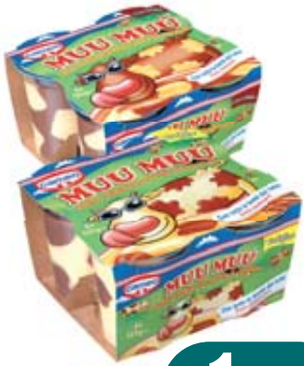
MUU MUU CAMEO CIOCCOLATO/ VANIGLIA 125G X4