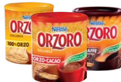
ORZORO SOLUBILE NESTLÈ 100% ORZO/ ORZO E CAFFÈ/ ORZO E CACAO 120/180G