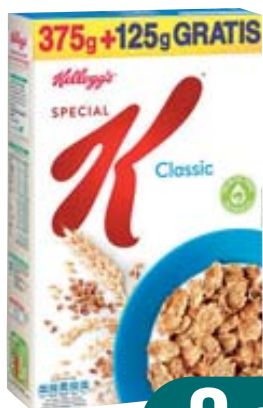
SPECIAL K KELLOGG'S CLASSIC 375G + 125G