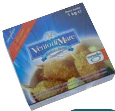
CHELE GRANCHIO VENTO DI MARE 1KG