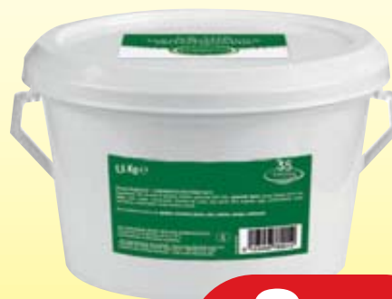
PESTO VOGLIAZZI 1,5KG