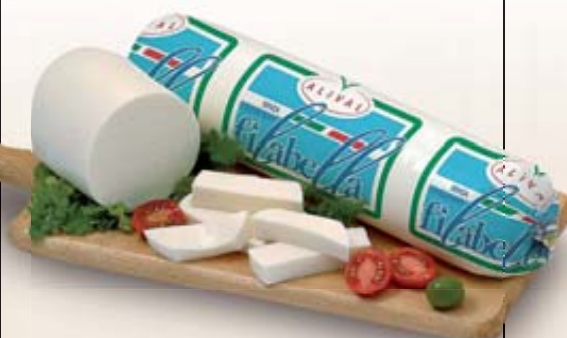
FILABELLA ALIVAL AL KG