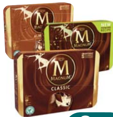
MAGNUM ALGIDA VARI GUSTI X4