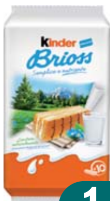
KINDER BRIOSS 280G