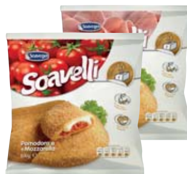
SOAVELLI VARI GUSTI 500G