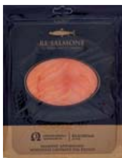
SALMONE NORVEGESE RE SALMONE 1200G